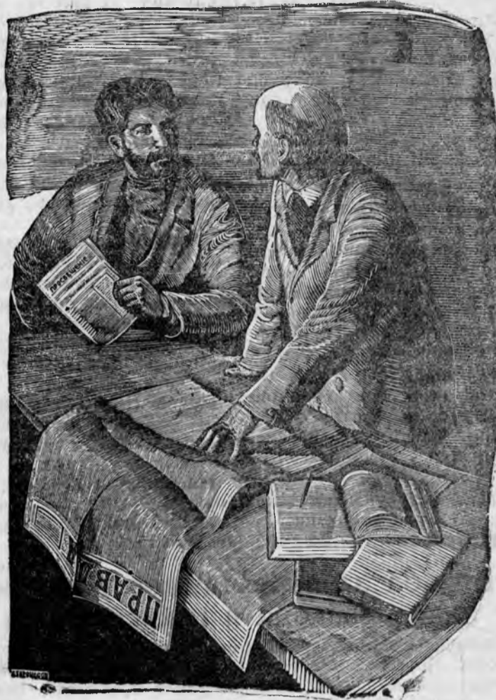
В. И. ЛЕНИН и И. В. СТАЛИН в Кракове (1912 год).

Крепить связь с массами, учиться у Ц. О. нашей партии «Правды», работать так, как работает «Правда», — вот задача нашей районной и политотдельских газет совхозов.